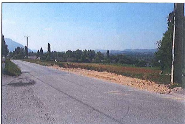
Aménagement d'un cheminement piéton de Martinet à Basset