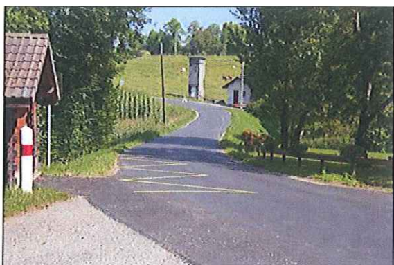
Réfection de la RD203 à hauteur de Champfleury

Le conseil général a refait les couches de surface sur la route de la Balme et sur la route de Cercier (Champfleury). Aux Marais Pontaux (sur Allonzier), les travaux sur le réseau d'eau potable (changement de la canalisation) ont été réalisés avant la réfection de la voirie.