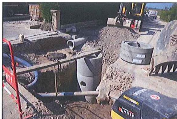
Travaux du Sila à Véry

A Véry, depuis juin, le SILA a entrepris la 1 ère tranche des travaux de construction du réseau d'assainissement collectif (du Pont Noir à la route du Vieux Véry) pour un montant de 411 640 €. Ces travaux engendrent de gros moyens techniques : la profondeur de la tranchée atteignant par endroits 4,50 m.